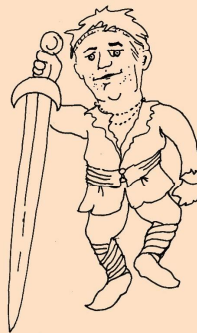
Premysl, kníže český - Lada Ozvoldík