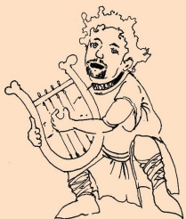
Lumír, božský pěvec - Aleš Malach