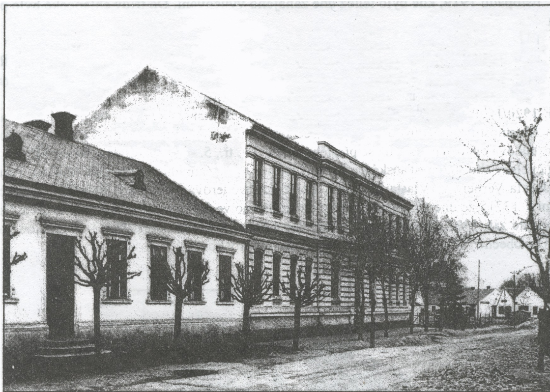
4. Nová škola ve dvacátých letech

Šk. r. 1925/6 - Dle zákona č. 286 sb. z. a. n. o úsporných opatřeních (restrikce) ze dne 22. prosince 1924 byly ve šk. r. 1925/6 definitivní pobočky při 1. a 2. tř. zrušeny, obecná škola je tedy pětitřídní s pobočkou při 5. tř. jako třídou závěrečnou. Žáci a žačky měšťanské školy podnikli za doprovodu čtyř učitelů ve dnech 25. - 28. června výlet do Vysokých Tater.