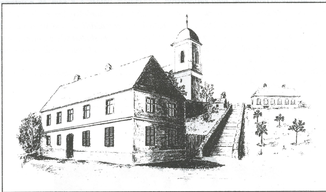
1. Národní škola ve Svitávce kolem roku 1890 (rekonstrukce, kresba tužkou)

Bez zajímavosti nejsou následující výňatky z první školní kroniky, vztahující se k období výuky ve staré škole.