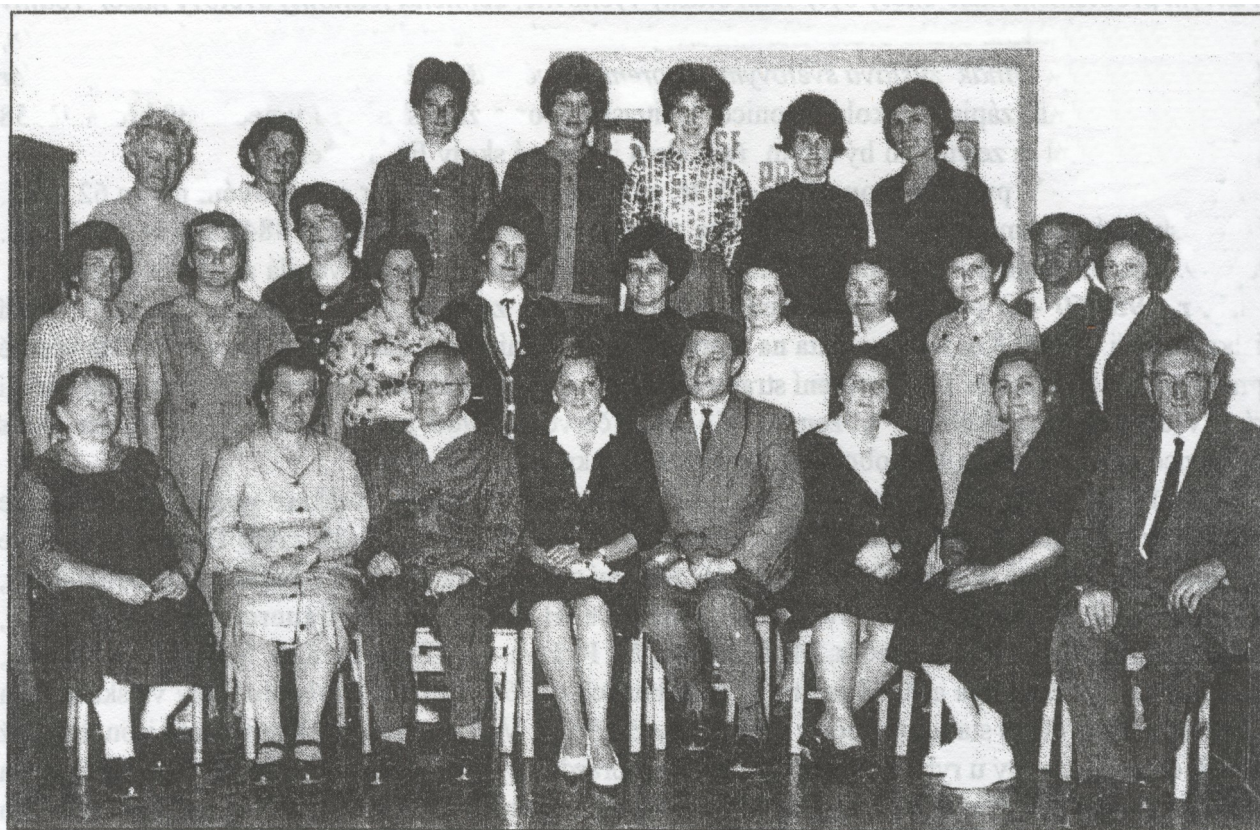
7. Učitelský sbor a správní zaměstnanci v roce 1966

Šk. r. 1966/7 - Pro druhé pololetí byl vypracován nový rozvrh hodin s ohledem k té skutečnosti, že od 6. února jsou na ZDŠ zavedeny pokusně volné soboty (každá sudá). V březnu bylo na pokyn ONV provedeno přezkoumání všech učitel. vysvědčení a diplomů, učitelé vyplnili tiskopisy jako podklad pro nové platy, které byly zvýšeny v průměru o 300 Kčs.