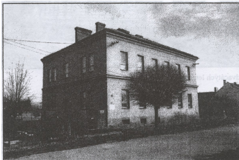
3. Budova bývalé opatrovny sloužila také obecní škole. Foto 1997.