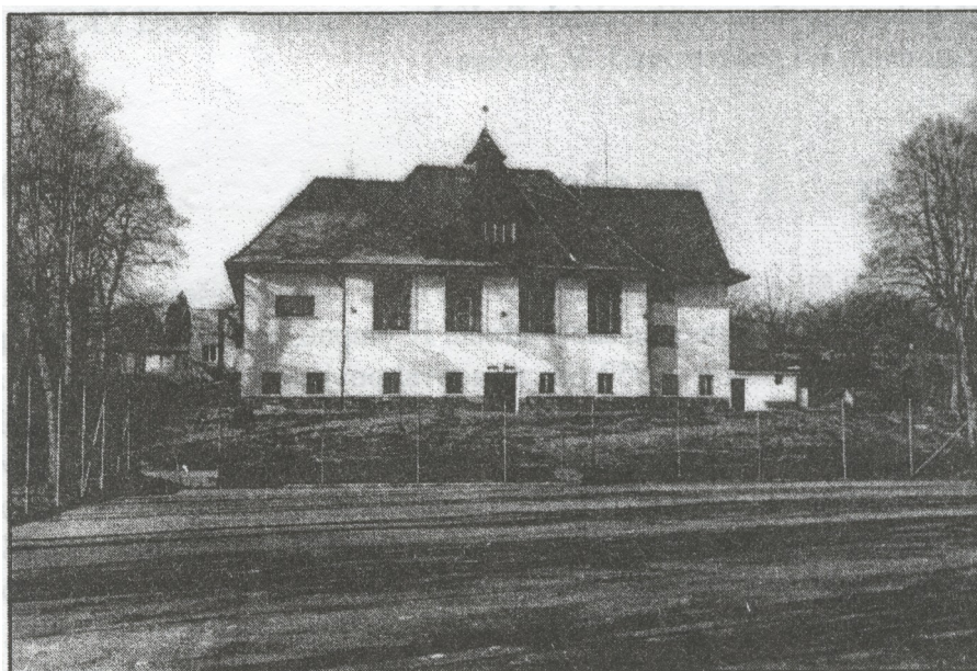
6. Svitávecká sokolovna. Po slavnostním otevření 18. září 1927 sloužila především žákům školy. Foto 1996.