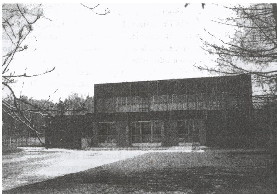
8. Nová školní tělocvična byla otevřena v r. 1987. Foto 1996.

Šk. r. 1986/7 - Ze školy odchází do funkce ředitelky ZŠ Tyršova 2 v Letovicích dlouholetá učitelka na zdejší škole, Blanka Věrná. V tomto šk. r. bylo dokončeno dřevěné obložení chodeb, taktéž dokončena byla rekonstrukce nové kotelny včetně postavení nového komínu. V pátek 27. března 1987 proběhla kolaudace nové školní tělocvičny postavené v akci „Z“, hodnota díla představuje částku 4 648 000 Kčs. Cvičit se zde začalo 1. dubna 1987. Podle finančních možností je tělocvična postupně vybavována potřebným náradím. Slouží také pro oddíl kolové ISOCORP Svitávka. Upravena je i ŠD, větší z obou místností ŠD je vybavena novým nábytkem. Závěrem roku 1986 je za 182 000 Kčs uskutečněna koupě Koháčkova domu, sousedícího se školou, pro účely vybudování školních dílen.