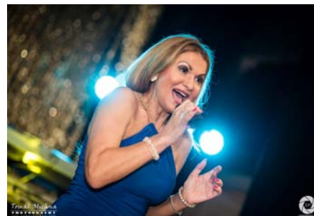
Frýbortové – bronzové medailistky z Mistrovství světa.

Přestávky mezi hudebními koly vyplňoval pestrý program. Ať už šlo o žongléřskou sestavu Ardor Viridis, která v zatemnělém sálu předvedla světelnou show nebo působivou podívanou v krasojízdě na kole Nicole