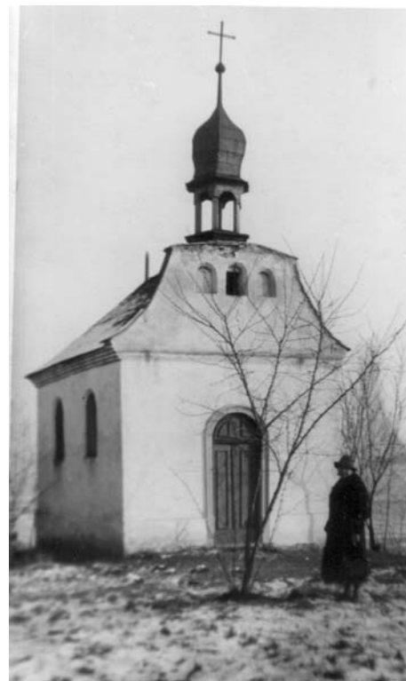
Původní kaplička na Hradisku, foto ze čtyřicátých let minulého století.