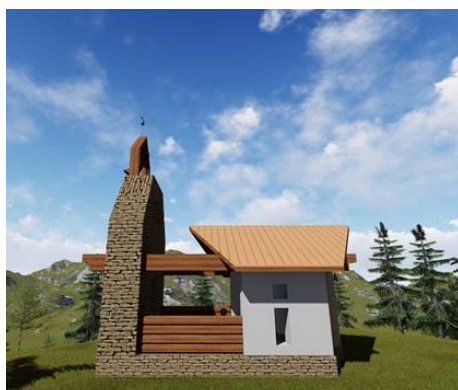
Budoucí podoba obnovené kapličky.